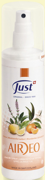
SPRAY AMBIENTAL Para una atmósfera de frescor limpio en todos los ambientes, contra los olores desagradables. Con limón, mandarina, eucalipto y salvia. 200 ml

Higiene y equilibrio cutáneo que respeta las exigencias de los perros y gatos , con delicados ingredientes naturales que ofrecen un verdadero bienestar a los animales y más seguridad a toda la familia.