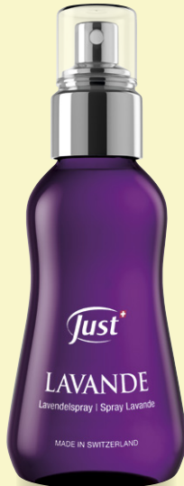
SPRAY LAVANDA Spray intensamente aromático con aceite esencial de lavanda, conocida por sus virtudes protectoras. Con lavanda. 115 ml