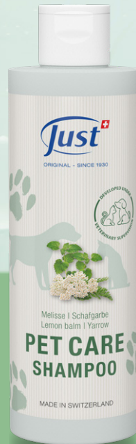
CHAMPÚ PERROS Y GATOS Limpia delicadamente y en profundidad cualquier tipo de pelaje, y mantiene el equilibrio cutáneo correcto respetando el pH natural. Adecuado para un uso frecuente. Con ortiga, milenrama y melisa. 200 ml